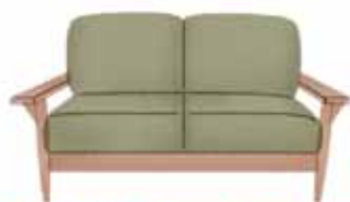
自然のモチーフや機能性を大切にスタイルは、日本の伝統にも通じます。